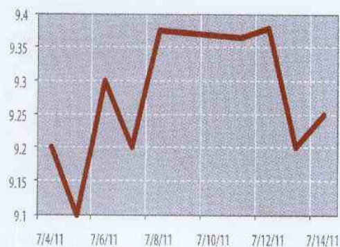
Pivovarna Laško (PILR).